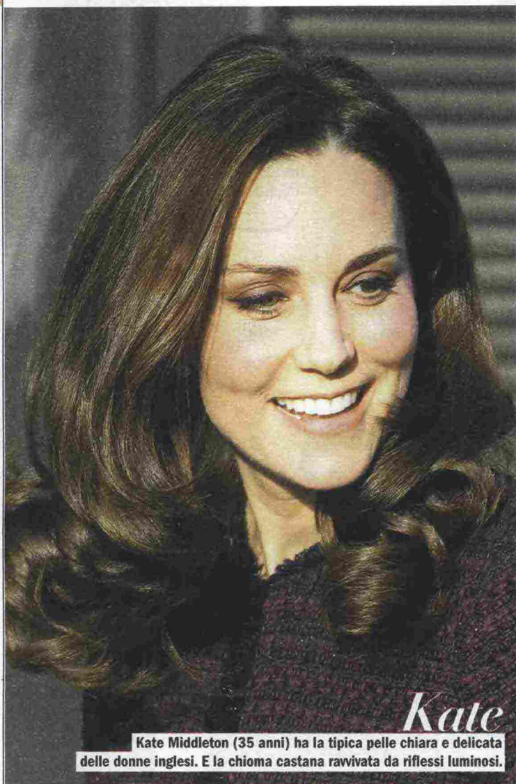
Kate Kate Middleton (35 anni) ha la tipica pelle chiara e delicata delle donne inglesi. E la chioma castana ravvivata da riflessi luminosi.