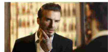
Medicina estetica: addio bisturi?