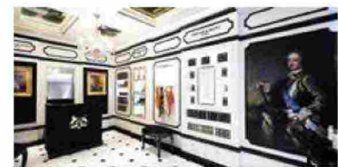
Parfums de Marly, la profumeria nobile di Parigi