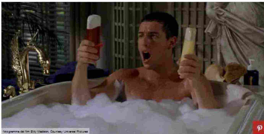
Fotogramma del film Billi Medson . Courtesy Universal Pictures

È un fenomeno in costante crescita, quello della cosmesi naturale, destinato a segnare l'evoluzione del settore anche nei prossimi anni: il consumatore cerca sempre più prodotti green come lo shampoo naturale. La tendenza oggi è preferire trattamenti biologici, come shampoo e balsami che non aggrediscono i capelli, i gel e le maschere più rispettosi per l'ambiente, non testati su animali, amici della salute, magari personalizzati. Ampia la scelta di trattamenti per i capelli: si spazia da quello a base di argilla ad azione rigenerante e ideale per calmare i fastidi della cute sensibile a quello di ricostruzione profonda, indicato per i capelli danneggiati, a base di aminoacidi e coenzima Q10, che dona forza e corposità e ripara la fibra capillare. Dalla pulizia con oli essenziali, a quello ristrutturante a base di soia, orzo, arnica, semi di lino ed erbe montane. La scelta nel campo degli shampoo e dei trattamenti bio per capelli è ampia.